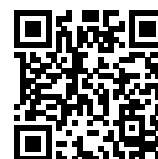
連絡メール2 保護者ログイン

* 保護者サイト https://renraku.education.ne.jp/parent/